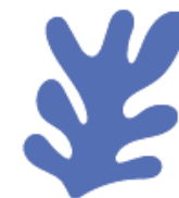
Augalinės klimės produktai